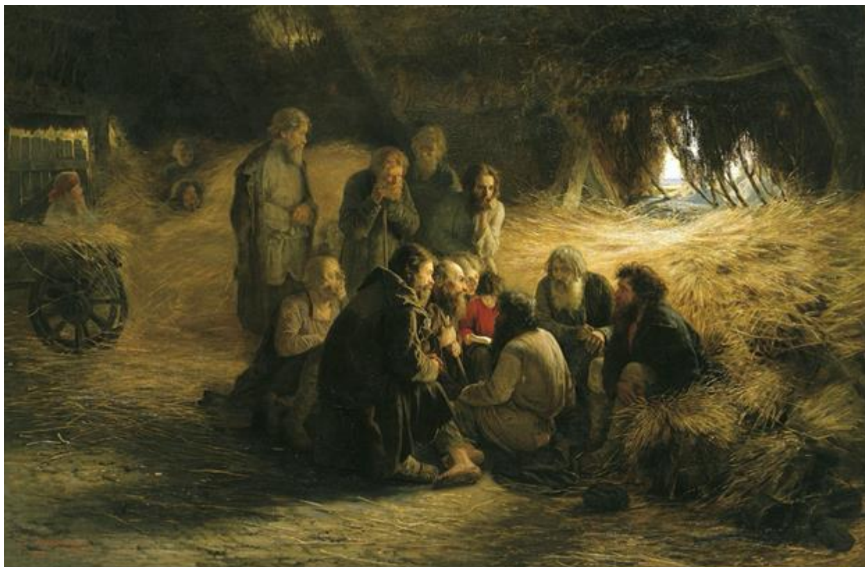
Григорий Мясоедов «Чтение Положения 19 февраля 1861 года». Государственная Третьяковская галерея, Москва.