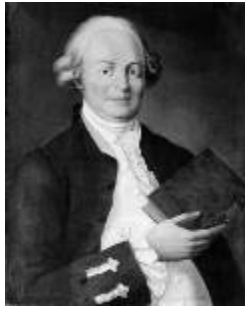
Тредиаковский / Тредьяковский