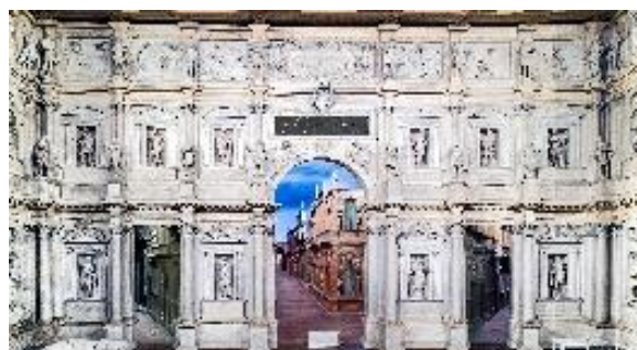
Театр Олимпико в городе Виченце