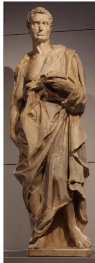
7. Донателло. Пророк Иеремия. 1423–1426