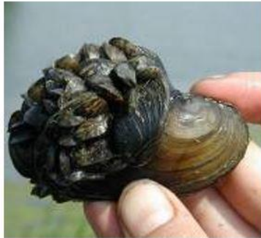
а) Речная дрейссена

Выберите виды-интродуценты, которые прежде не встречались на Европейской территории нашей страны.