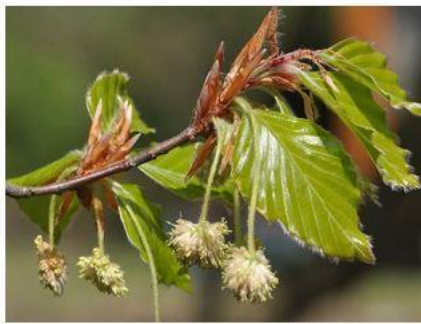
г) Бук лесной