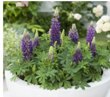
в) Люпин многолистный