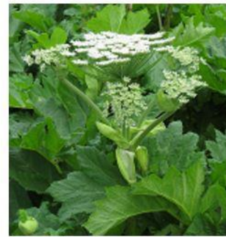
е) Борщевик Сосновского