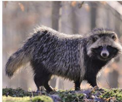
б) Собака енотовидная