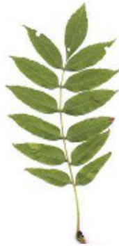
д) Ясень обыкновенный