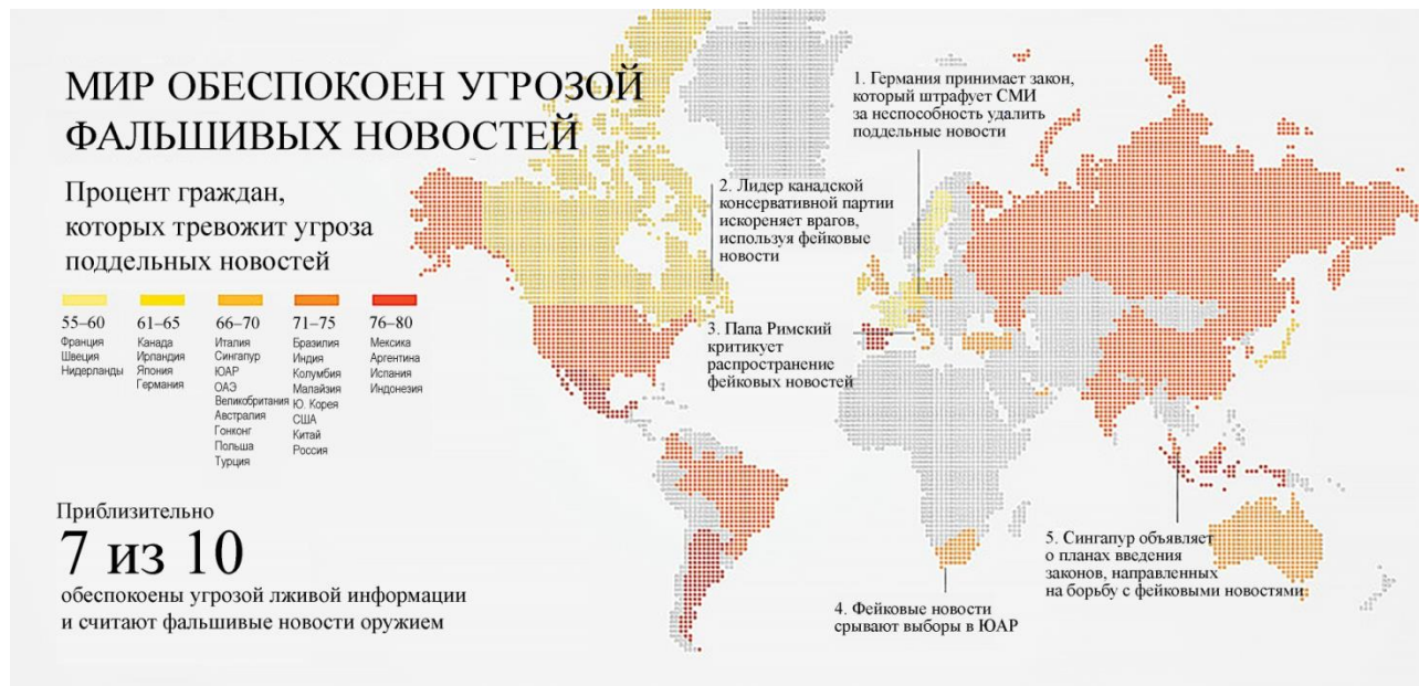
Рис. 1. Распределение стран и административных единиц в мире по степени угрозы фальшивых новостей, 2018 г.

6-12. Ознакомьтесь с материалами и выполните задания.