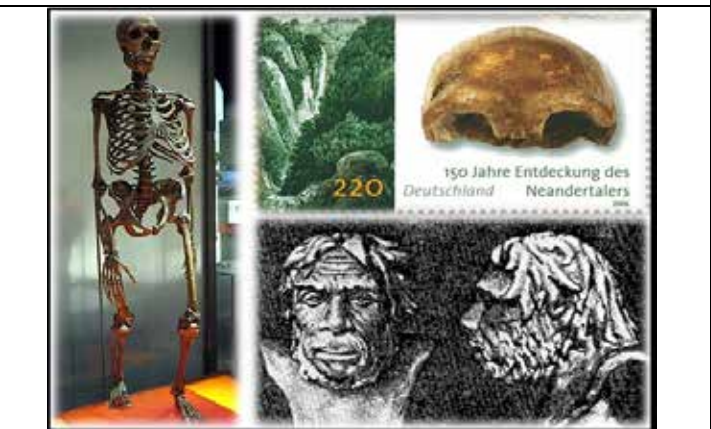
скелет и изображение неандертальского человека