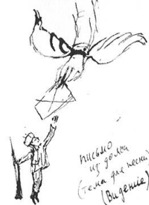
Кукольный театр Казани