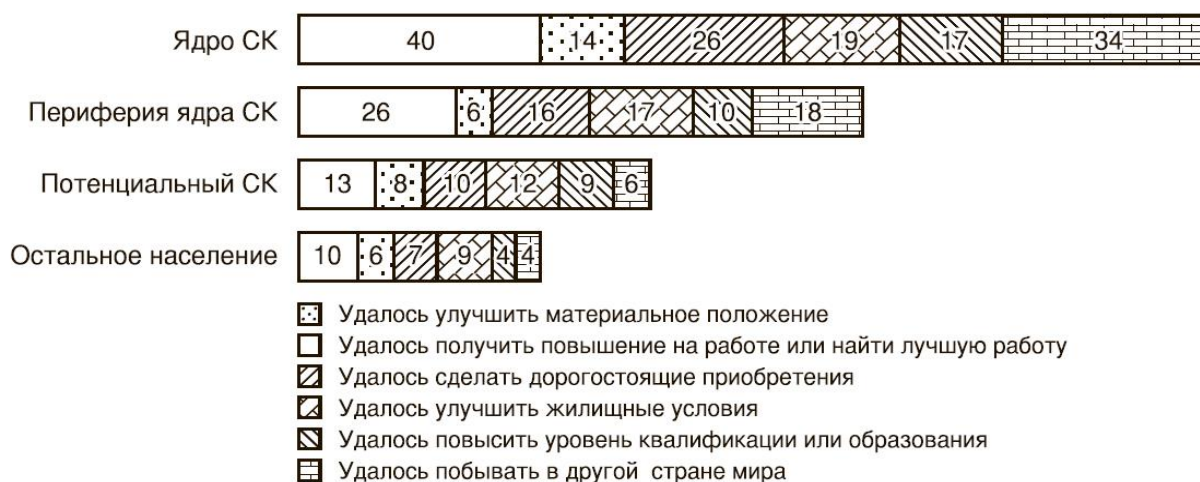
Рис. 2. Доля сумевших достичь в течение 3-х лет перед опросом тех или иных значимых улучшений своей жизни в различных группах населения, 2014 г. (в %, данные по улучшившим свою производственную ситуацию и повысившим квалификацию приводятся в % от работающих представителей соответствующих групп).

Стоит отметить, что, хотя средний класс и сегодня выглядит гораздо более успешным по сравнению с другими группами населения, динамика его достижений за последнее десятилетие выглядит неутешительно.