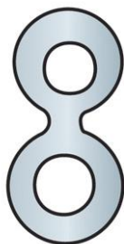
Рис. 1. Брелок из цифры «8»

Примечание. Брелок с цифрой «8» не разрабатывать!