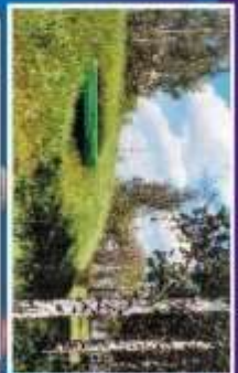
Исторический музей культуры набережной 5 кв. восточной стороны проспекта И.А. Петрякова