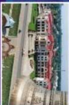
Культурно-исторический центр Третьего района под названием «Историческое подье»