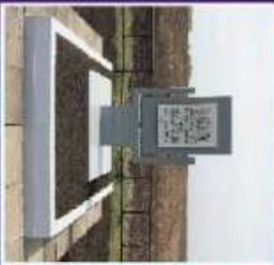
Павильон парка на месте виллы Евгения Соколова в Салае с проспекта аэропорта И.И. Митрофанова