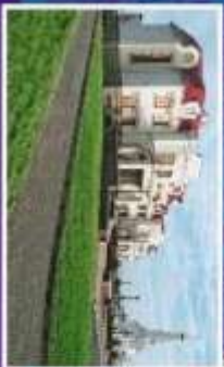
Виллы Евгения Соколова на проспекте И.А. Петрякова