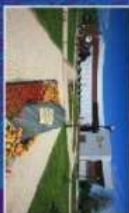
Музей боевой славы Третьего района под названием «Историческое подье»