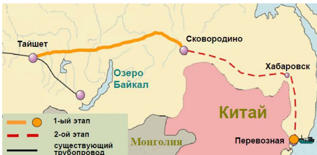
Маршрут строительства нефтепровода «Восточная Сибирь – Тихий Океан»