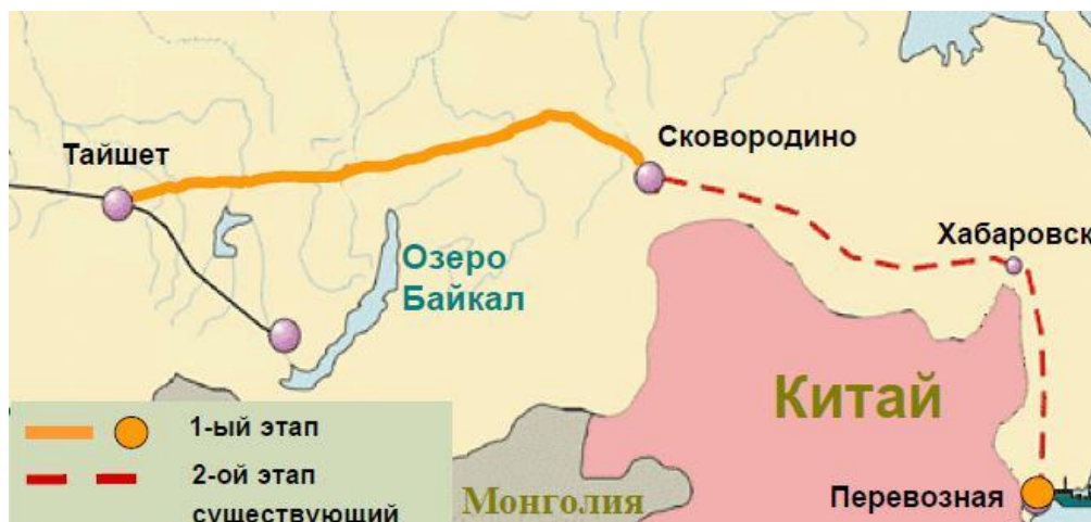
Маршрут строительства нефтепровода «Восточная Сибирь – Тихий Океан»